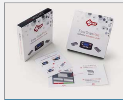
"Software Activation Code" Schachtel

Die Software wird aktiviert, indem die 4 Codes eingegeben werden, die sich in der Schachtel "Software Activation Code".